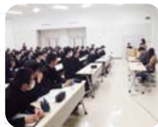
大学探検（金沢大学）