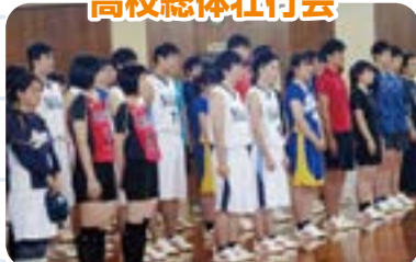
全校の後押しでいざ、出陣!