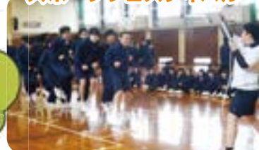
寒さを吹き飛ばす熱気