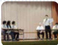
生徒会企画のゲーム