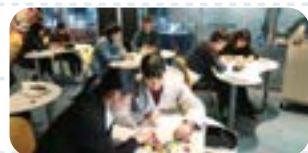
キャリアワークショップ