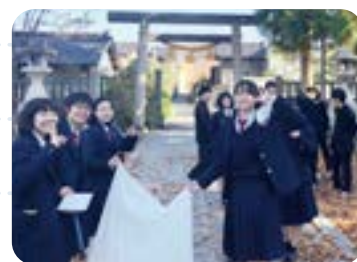
HR で地元の清掃奉仕