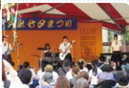
七夕祭りステージ発表 (軽音楽部)