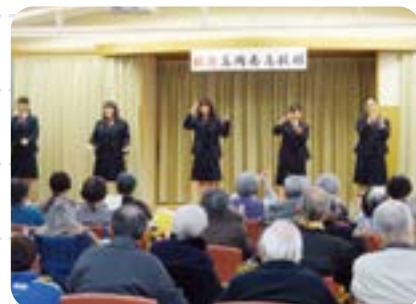
地元の高齢者福祉施設にて (合唱部)