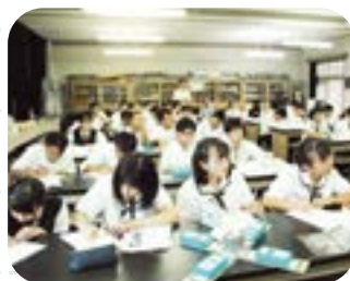
キャリアデザインゼミナール「学問への誘い」