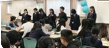
現地高校生との交流