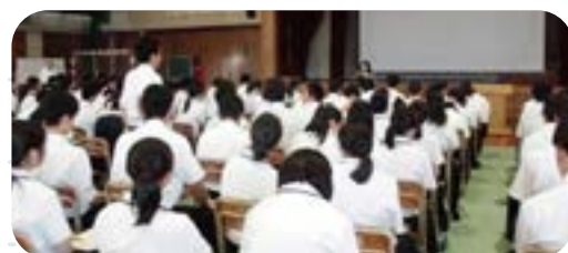
キャリアデザインゼミナール（全体会）

また、大学をより身近に感じられるよう、キャンパス見学や同窓生との懇談等を行い、進路選択の参考にしています。