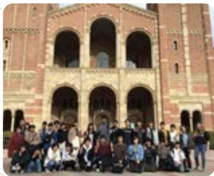
UCLA キャンパスツアー

研修の中身はとても濃く、アメリカでの交流は僕の人生の糧となりました。この経験を勇気と自信にして新しい挑戦を続けていきます。 (2年 男子)