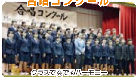
クラスで奏でるハーモニー