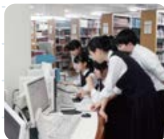
富山大学での図書館文献検索