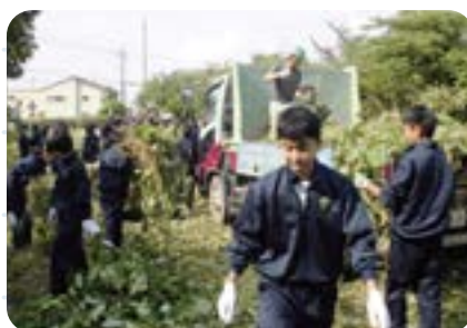
七夕ボランティアでの除草