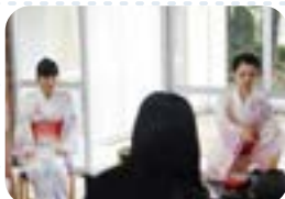
茶道部によるお茶会