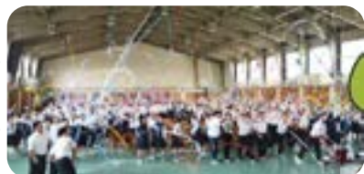
「一・二・三 エイッ」南高祭フィナーレ