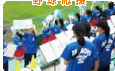
「カッセー カッセー南高」