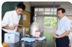
科学部による実験