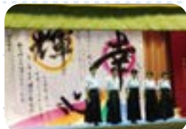
書道部のパフォーマンス

本校の学園祭「南高祭」は毎年秋に開催されます。文化部の発表を中心に様々な企画があり、南高生のエネルギー・感性の発露の場となっています。