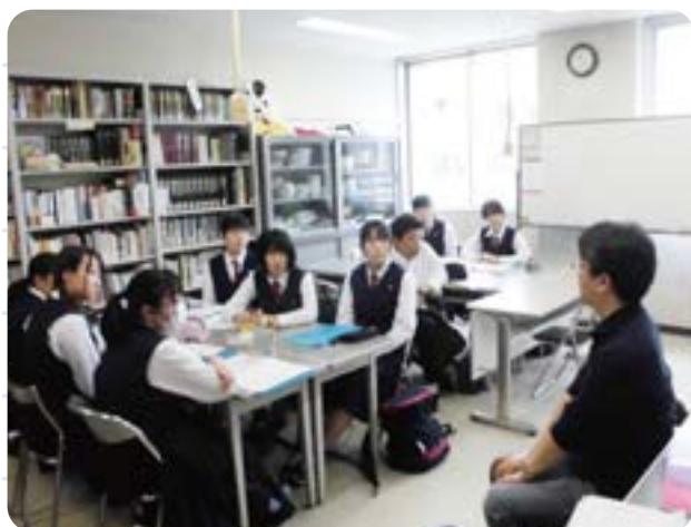
富山大学のゼミ訪問