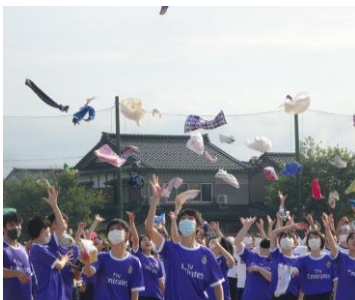
←今年の南高祭フィナーレ

※申し込まれた方には11月3日(火)までに申し込み受理の連絡をいたします。 受理の連絡がない場合や、ご質問等がありましたら高岡南高校までご連絡ください。