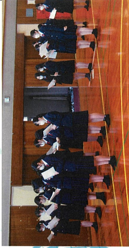
↑音合わせをする3年生