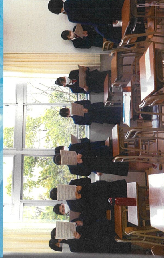
↑音程を確認する3年生の姿

4月28日（木）に行われる3年ぶりの合唱コンクールに向けて、各クラスで合唱の練習が始まった。どのクラスでもパートごとに分かれ、指揮者、伴奏者、パートリーダーが率先して練習していた。コロナの感染対策のため、合唱する際は、顔を向き合わせずに一列に並んで美しい歌声を響かせていた。