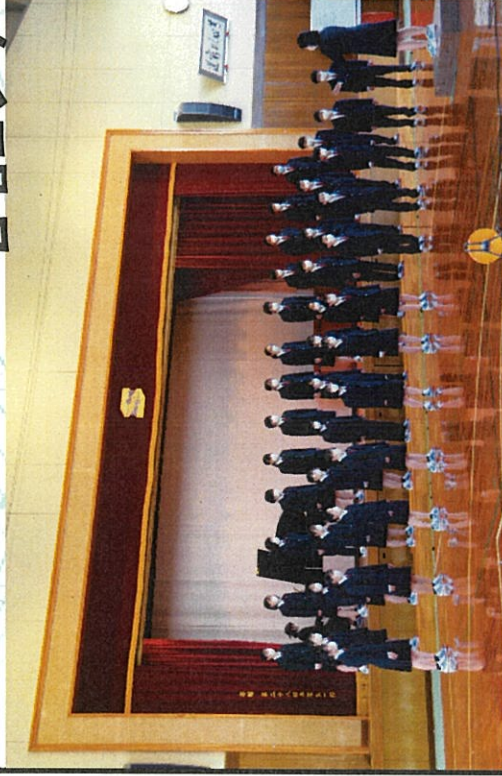
↑リハーサルを行う一年生