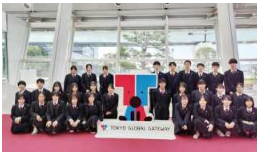
国際理解研修にて