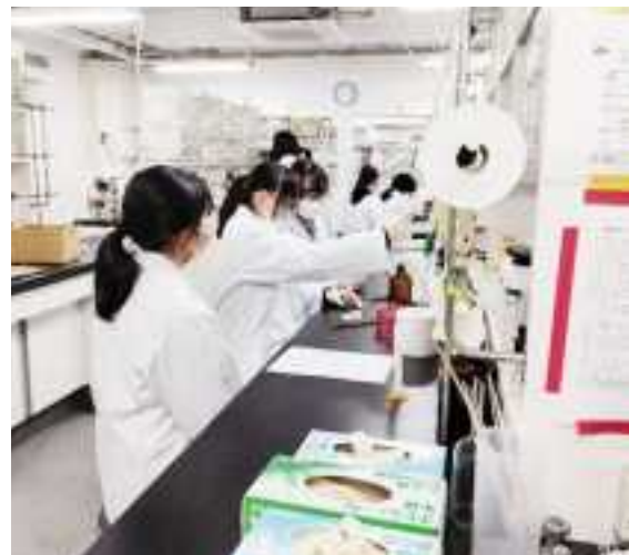
富山大学 薬学実習より

アメリカシリコンバレーを拠点に活躍されている起業家の方に、オンラインでお話をいただき挑戦心を育てます。