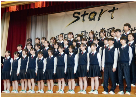
4月 合唱コンクール